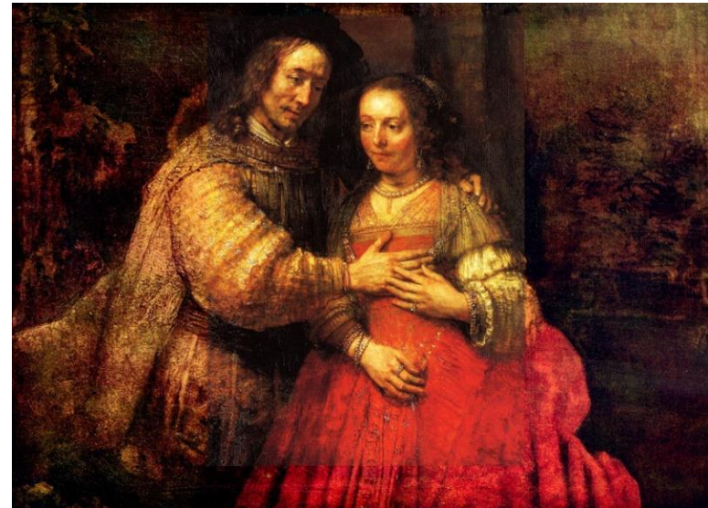
« La fiancée juive » Rembrandt Rijksmuseum -Amsterdam, 1667